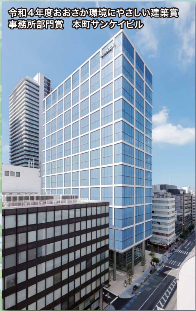
令和4年度おおさか環境にやさしい建築賞 事務所部門賞 本町サンケイビル