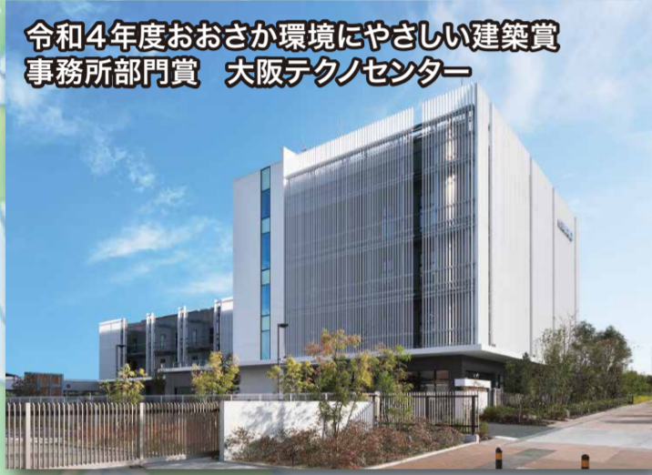
令和4年度おおさか環境にやさしい建築賞 事務所部門賞 大阪テクノセンター