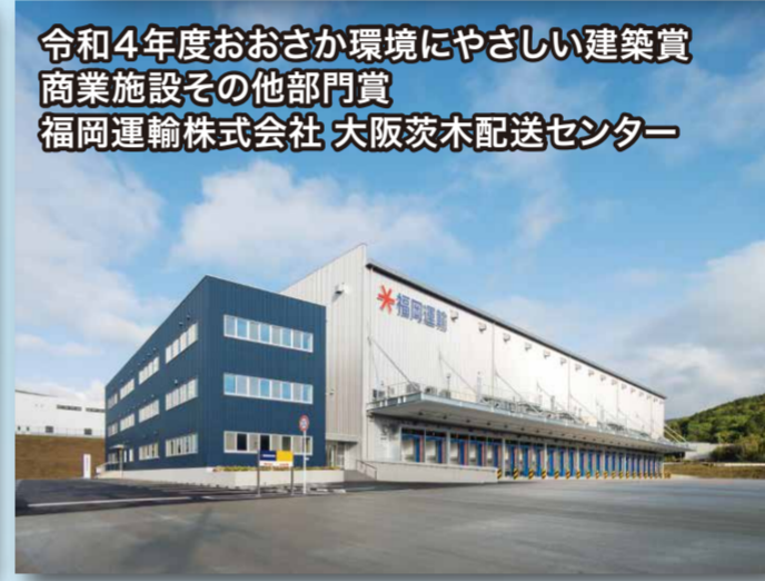
令和4年度おおさか環境にやさしい建築賞 商業施設その他部門賞 福岡運輸株式会社 大阪茨木配送センター