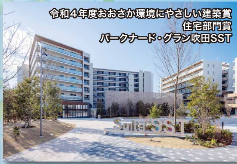
令和4年度おおさか環境にやさしい建築賞 住宅部門賞 パークナード・グラン吹田SST