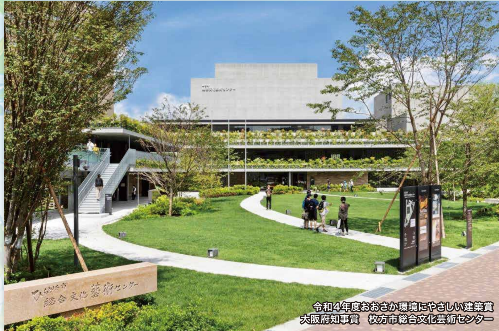
令和4年度おおさか環境にやさしい建築賞 大阪府知事賞 枚方市総合文化芸術センター