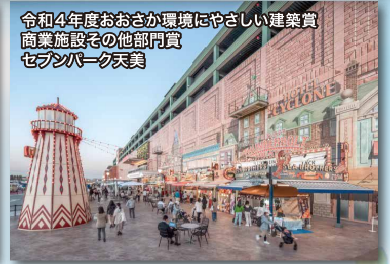
令和4年度おおさか環境にやさしい建築賞 商業施設その他部門賞 セブンパーク天美