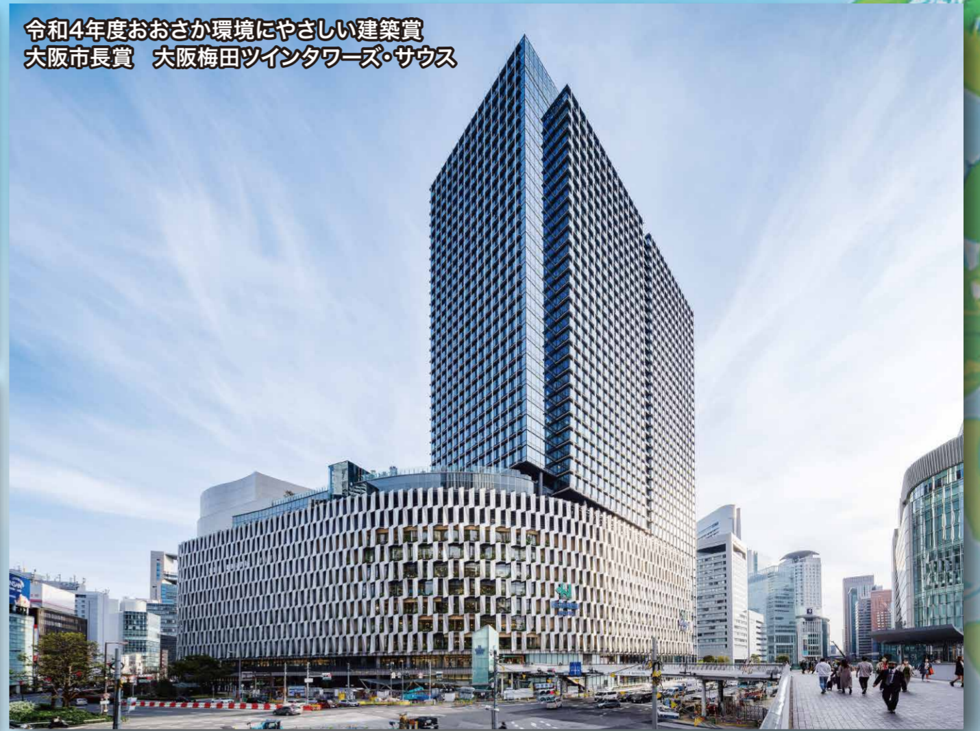
令和4年度おおさか環境にやさしい建築賞 大阪市長賞 大阪梅田ツインタワーズ・サウス