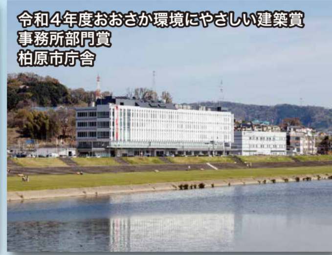
令和4年度おおさか環境にやさしい建築賞 事務所部門賞 柏原市庁舎