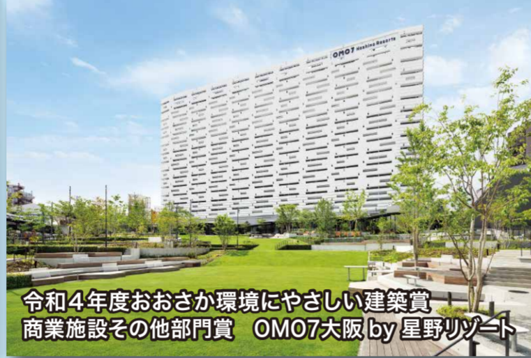
令和4年度おおさか環境にやさしい建築賞 商業施設その他部門賞 OM07大阪by星野リゾート