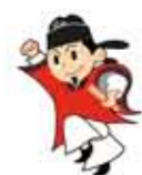
豊住野市公式キャラクター まなりくん

11:30 あまーい言葉にご用心① デート商法編(漫才) 大阪市立大学落語研究会