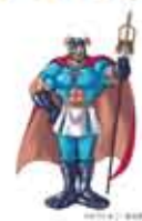
豊住野市公式キャラクター 一休大助(イヌナキン)