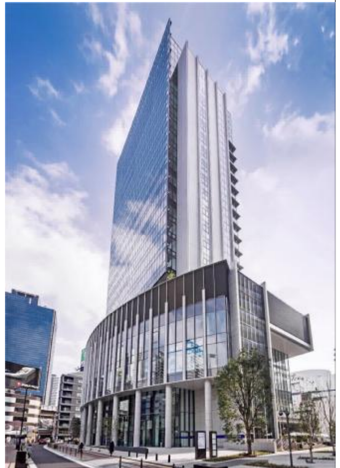
大阪市長賞 大阪工業大学梅田キャンパス OIT 梅田タワー

これまで豊田市自然観察の森ネイチャーセンターをはじめ たくさんのプロジェクトを手掛け、最近では 2017 年 2 月に (仮称)大阪新美術館公募型設計競技において最優秀賞に選 定されるなどご活躍である。