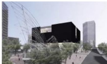
大阪新美術館 イメージ図

1970 年横浜市生まれ。 東京大学大学院修士課程 修了。1997 年遠藤建築 研究所設立、2007 年(株) 遠藤克彦建築研究所に組 織変更、現在に至る。